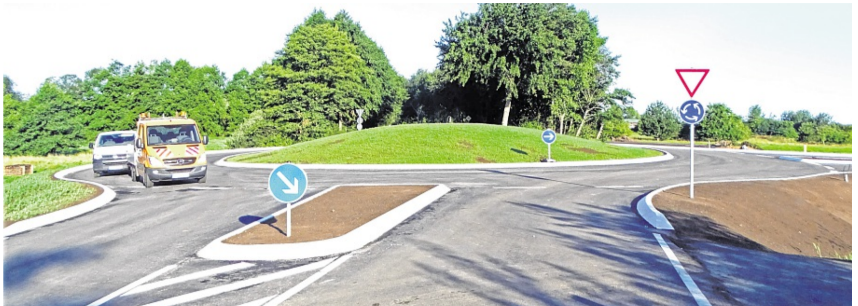
Seit Dienstagmorgen kann der Verkehr rollen.

WYK Der Wyker Turnerbund (WTB) hält seine Jahresversammlung morgen, Donnerstag, 27. August, ab. Neben Berichten stehen auch Wahlen auf der Tagesordnung. Die Zusammenkunft findet im Helu-Heim am Olhörnerweg statt und beginnt um 19 Uhr.